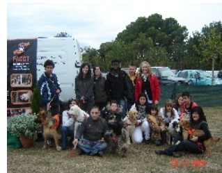
Projecte Tan Amigos