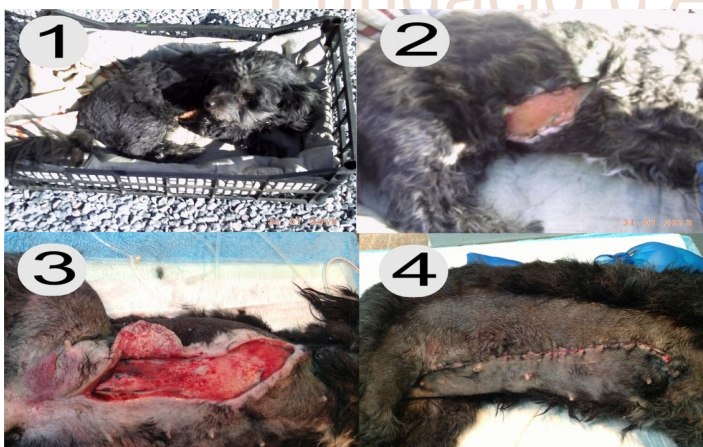
Així va arribar Sort

http://www.youtube.com/watch?v=ksx_JwW5nBw