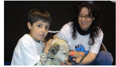
Fira bestial 2012

Pel que fa a adopcions, i en particular als gossos, podem dir que l'any 2.012 ha estat un bon any. No només hem mantingut el total d'adopcions que l'any anterior, sinó, que hem augmentat una mica el total d'adopcions definitives. A més creiem que aquest any encara podem augmentar més el nombre total d'adopcions, ja que el principal motiu d'aquest bons resultats es l'atenció al visitant i possible adoptant. I aquesta atenció ha millorat gràcies a l'ajuda que ens han estat donant els apadrinadors, realitzant una formidable tasca d'assessorament i informació als visitants. Aprofitem per demanar-vos que ens ajudeu a difondre l'adopció, explicant als vostres coneguts, familiars i amics, que a l'Última Llar tenim aproximadament uns 250 gossos i 75 gats esperant trobar una nova família. Esperem que entre tots podem aconseguir moltes famílies per a aquest animals.