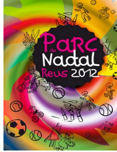
Parc de Nadal 2012