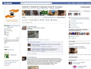
Plana del Facebook Fundació