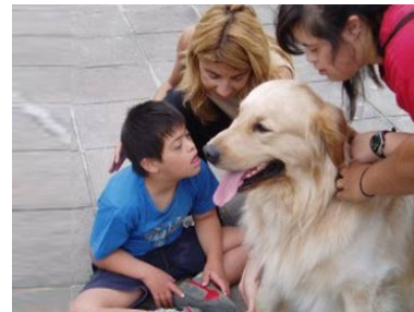
Teràpia amb animals de companyia

Agraïm al Taller Baix Camp la col·laboració amb la nostra Fundació amb una activitat tant beneficiosa per les dues entitats.