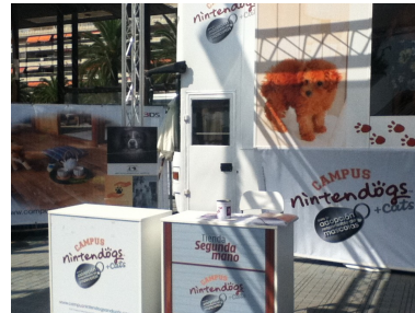
Campus Nintendo Dogs Salou

Aquest agost hem signat conveni de col·laboració amb el taller Baix Camp, entitat sense ànim de lucre declarada d'utilitat pública amb seu a Reus, que actua per a totes les persones amb discapacitat intel·lectual adultes i les seves famílies, preferentment de la comarca del Baix Camp, per que els seus integrants col·laborin amb la campanya d'apadrinaments d'animals que es realitza a les instal·lacions de l'Última Llar i es puguin beneficiar del contacte directe amb animals de companyia, ja que esta demostrat que es molt beneficiós per la millora del benestar diari, de les persones afectades per una discapacitat intel·lectual. Si voleu més informació de les activitats del Taller Baix Camp, aquí uns deixo un enllaç a la seva plana web.