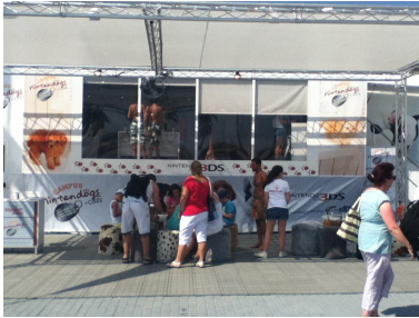
Campus Nintendo Dogs Salou

Aquest estiu els dies 4, 5 i 6 d'agost la nostra Fundació ha estat a Salou al passeig Jaume I, col·laborant amb Nintendo per la promoció de la tinença responsable d'animals de companyia, volem agrair a Nintendo la iniciativa que ha tingut ja que cada cop es més difícil que empreses privades deixin de banda els seus interessos comercials i facin quelcom per promocionar la tinença responsable d'animals de companyia, encara que sigui per alhora fer promoció dels seus productes. Dintre del Campus Nintendo Dogs, s'ha fet una petita desfilada de gossos de L'última Llar i s'han donat unes petites xerrades de tinença responsable, per conscienciar a la població de Salou i als turistes d'altres localitats que visitaven la localitat, de la importància que te evitar l'abandonament injustificat d'animals de companyia.