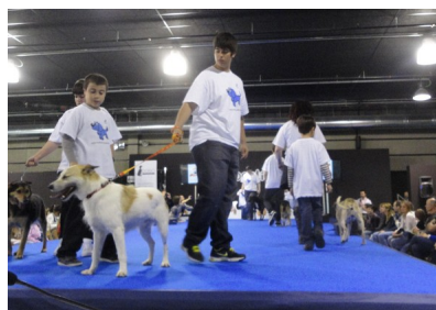
Fira Bestial III