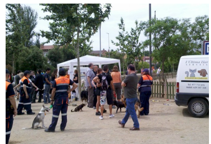
Passejada de Gossos