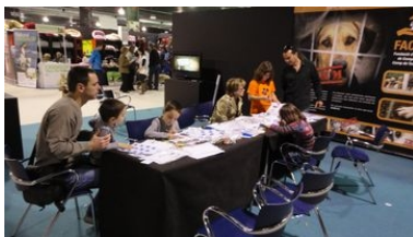
Taller infantil de tinença responsable Fira Bestial 2011

El cap de setmana del 26 i 27 de març es va fer, al nou recinte firal de Reus, la segona edició de la Fira Bestial. La primera fira dedicada als animals de companyia que es fa a les nostres contrades. La nostra fundació va estar present com expositora i es va aprofitar el marc de la fira per realitzar dues desfilades de gossos en adopció, amb la col·laboració dels nostres apadrinadors. També es va realitzar un taller de conscienciació de tinença responsable d'animals de companyia adreçat als nens en un stand paral·lel, que ens va cedir la pròpia fira. Aquest taller era molt semblant al que es va fer a l'última edició del Parc de Nadal de Reus. Finalment vam tenir ocasió, dins de la mateixa fira, d'oferir una xerrada de conscienciació per la tinença responsable, adreçada bàsicament al públic adult.