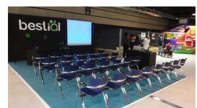
Espai xerrades Fira Bestial 2011

Estem molt satisfets per la presència a la fira Bestial pel que suposa a la promoció de la tinença responsable i al respecte als nostre animals de companyia. També va ser molt positiva la promoció de l'adopció d'animals de companyia procedents de centres d'acollida i protectores, ja que la fira va ser un èxit pel que fa a l'afluència de visitants, segons dades de Fira de Reus, en el transcurs de tot el cap de setmana van visitar la fira aproximadament unes 9.000 persones. Finalment per tancar aquest apartat vull agrair a tots els apadrinadors, col·laboradors i simpatitzants de la nostra fundació, l'ajut prestat, ja que sense vosaltres hagués estat impossible organitzar totes les activitats que es van realitzar a la fira. Moltes gràcies a tots.