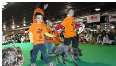
Desfilada de gossos en adopció Fira Bestial 2011